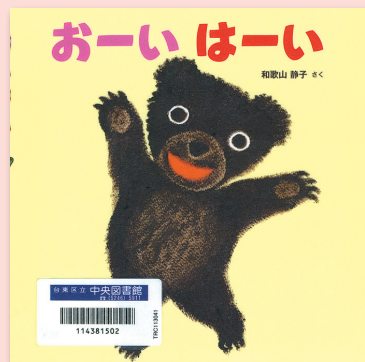
おーい はーい 和歌山静子 / さく ポプラ社