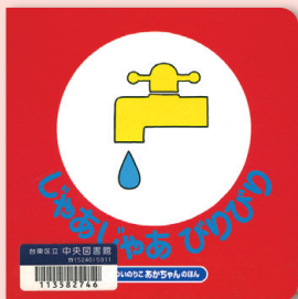
まついのりこ あかちゃんのほん じゃあじゃあ びりびり まついのりこ / 作・絵 偕成社