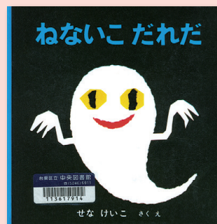
ねないこ だれだ せなけいこ / さく・え 福音館書店