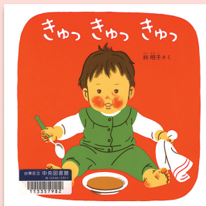
きゅっ きゅっ きゅっ 林明子 / さく 福音館書店