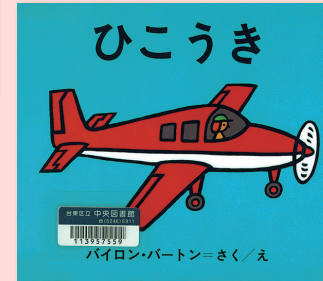
ひこうき バイロン・バートン / さく・え こじまもる / やく 金の星社