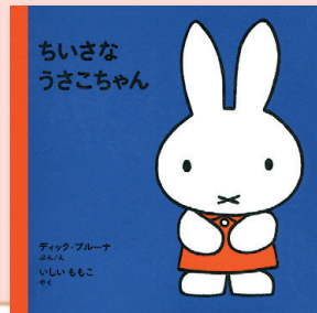
ちいさなうさこちゃん ディック・ブルーナ / ぶん・え いしいももこ / やく 福音館書店