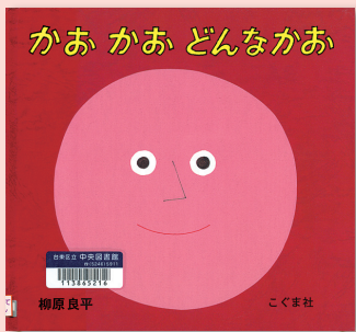
かあ かあ どんなかあ 柳原良平 / 作・絵 こぐま社