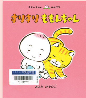
ももんちゃん あそぼう すりすり ももんちゃん とよたかずひこ / さく・え 童心社