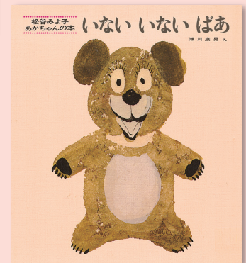
松谷みよ子 あかちゃんの本 いない いない ばあ 松谷みよ子 / 文 瀬川康男 / 絵 童心社