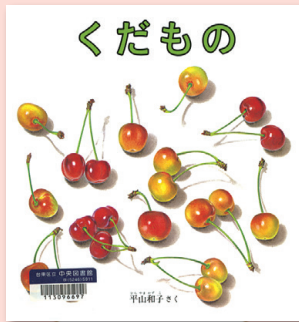
くだもの 平山和子 / さく 福音館書店