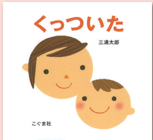
くっついた 三浦太郎 / 作・絵 こぐま社