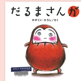
だるまさんが かがくいひろし / さく プロンズ新社