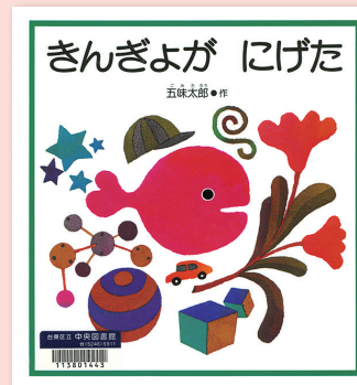
きんぎょが にげた 五味太郎 / 作 福音館書店