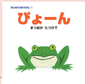
はじめてのぼうけん1 ぴょーん まつおかたつひで / 作・絵 ポプラ社