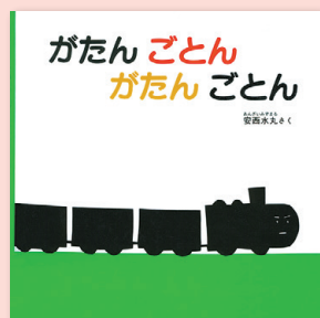
がたん ごとん がたん ごとん 安西水丸 / さく 福音館書店