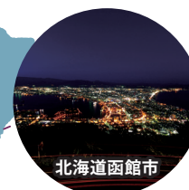
北海道函館市 ミシュランで三ツ星！ 「函館山からの眺望」