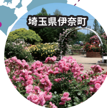
埼玉県伊奈町 バラ園