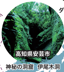
高知県安芸市 神秘の洞窟 伊尾木洞