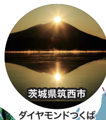
茨城県筑西市 ダイヤモンドつくば