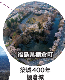
福島県棚倉町 築城400年 棚倉城