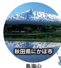
秋田県にかほ市 鳥海山