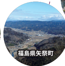
福島県矢祭町 矢祭山から見た町の風景