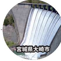
宮城県大崎市 鳴子ダムのすだれ放流