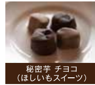
秘密芋 チョコ (ほしいもスイーツ)