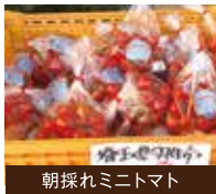
朝採れミニトマト