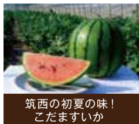
筑西の初夏の味！ こだますいか