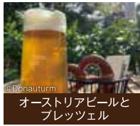
オーストリアビールと ブレッツェル