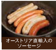
オーストリア直輸入の ソーセージ