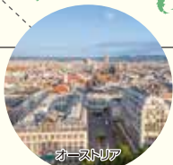
ウィーン / 市内中心部