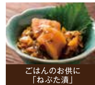
ごはんのお供に 「ねぶた漬」

青森市は、八甲田連峰や陸奥湾などの美しい自然に囲まれ、四季の彩りが豊かなまちです。また、日本を代表する火祭り「青森ねぶた祭」、世界文化遺産「三内丸山遺跡」や「小牧野遺跡」などの文化・歴史を有している魅力あふれるまちです。