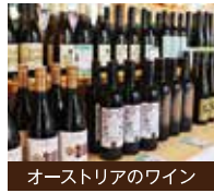
オーストリアのワイン

ヨーロッパの中心に位置し、歴史上に一大帝国を築き上げたオーストリアは、現代においても豊かで多彩な文化が、大都市や小さな地方都市にも、そしてアルプスの村々にも息づいています。台東区にてその文化の一部を体験していただければ幸いです。オーストリアのライフスタイルや文化、美味しいフードなどを紹介します。