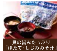
貝の旨みたっぷり 「はたて・しじみみそ汁」