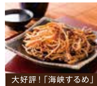
大好評！「海峡するめ」