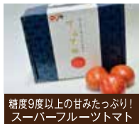
糖度9度以上の甘みたっぷり！ スーパーフルーツトマト