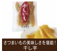
さつまいもの美味しさを堪能！ 干し芋

筑西(ちくせい)市は、日本百名山のひとつ筑波山の西側に位置し、風光明媚で豊かな自然環境に抱かれた茨城県の都市です。