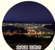
北海道函館市 ミシュランで三ツ星! 「函館山からの眺望」