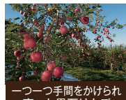
一つ一つ手間をかけられ育った黒石りんご