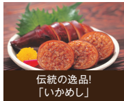
伝統の逸品! 「いかめし」