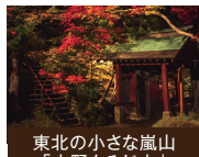
東北の小さな嵐山「中野もみじ山」

青森県の真ん中に位置する黒石市は、八甲田山麓の自然豊かなまちです。四季がはっきりと感じられ、種類豊富な温泉や藩政時代の情緒あふれる歴史的街並みを楽しむことができます。 地元で愛される逸品をどうぞお楽しみください。