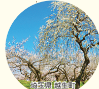
青森県越生町 関東三大梅林の一つ「越生梅林」