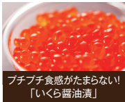
プチプチ食感がたまらない! 「いくら醤油漬」

函館市は、函館山からの夜景や五稜郭、さらには歴史的な景観などが有名な都市で、全国自治体魅力度調査で毎年上位に選ばれています。