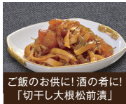
ご飯のお供に! 酒の肴に! 「切干し大根松前漬」