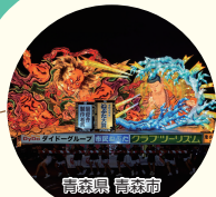
青森県青森市 青森ねぶた祭