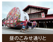
屋のごみせ通りと黒石ねぶた