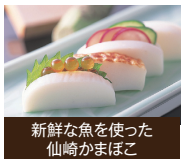
新鮮な魚を使った仙崎かまぼこ