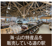
海・山の特産品を販売している道の駅