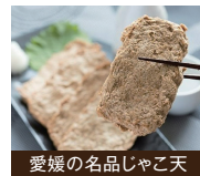
愛媛の名品じゃこ天