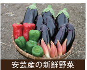
安芸産の新鮮野菜