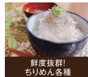
鮮度抜群! ちりめん各種