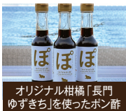
オリジナル柑橘「長門ゆずざち」を使ったボン酢