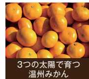
3つの太陽で育つ温州みかん