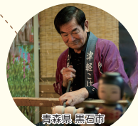
青森県黒石市 伝統の技!津軽系こけし