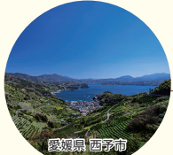
愛媛県西予市 宇和海狩浜の段畑と農漁村景観