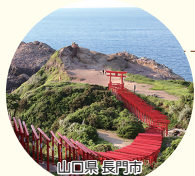
山口県長門市 CNN「日本の最も美しい場所31選」に選ばれた「元乃隅神社」

全国各地の自治体が1週間単位で入れ替わり、各地の魅力を発信する新しい形のアンテナショップです。毎週新鮮で珍しい特産品が揃い、懐かしいふるさとの魅力に出会えます。