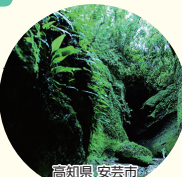
高知県安芸市 神秘的洞窟 伊尾木洞