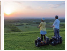
十勝千年の森セグウェイツアー