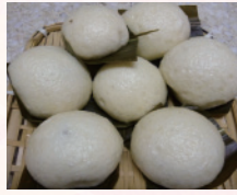
むかし懐かし故郷の味「酒まんじゅう」