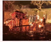
冬を彩る勇壮な祭り 緒方三社川越し祭り