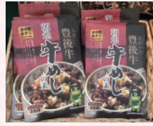
日本一豊後牛を使った牛めしの素