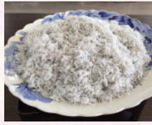
産地直送ちりめんじゃこ