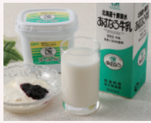
「あすなるファーム」の乳製品

北海道の中央、日高山脈の麓に位置する清水町は、広大な十勝平野の西端に位置する町です。畑作や酪農・畜産が盛んで、乳製品・肉製品や特産の小豆を使った商品が自慢です。町内には「世界で最も美しい庭」と評された十勝千年の森も。東京ドーム85個分の広大なガーデンでセグウェイツアーやチーズ作りが楽しめます。