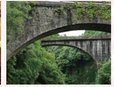
日本1,2位の径間を誇る石橋 出会橋と轟橋