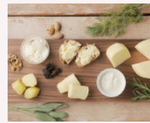
放牧酪農ナチュラルチーズ