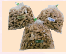
素朴な味わい マカロニボン菓子