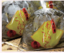
こんにやく農家から直送の「蒟蒻」