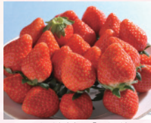
いちご市自慢の「いちご」

全国トップクラスの品質を誇るいちごの生産地「いちご市かぬま」は、台東区の皆様におなじみの「あわ野山荘」、そして、ユネスコ無形文化遺産に登録された祭りの主役「彫刻屋台」がある伝統息づくまちです。東武浅草駅から80分、遠いようで実は近い鹿沼市の魅力を、目で耳で、そして舌で体感し是非お越しください。