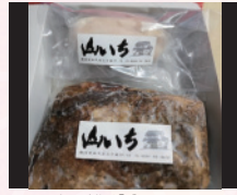
ラーメン店の手作り「ブロックチャーシュー」