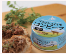
無添加コンビーフ