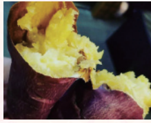
あったかホクホク甘〜い「はるか姫」石炭き芋

豊後大野市は九州大分県の南西部に位置し、「日本ジオパーク」と「世界ユネスコエコパーク」の両方に認定されている豊かな自然に囲まれた街です。豊かな水と肥沃な大地で育った多くの野菜は「大分の野菜畑」と言われる本市自慢の特産品です。懐かしい味「酒まんじゅう」もご準備しています。ぜひご来店ください。