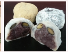
本別産あずき使用「大福3種」