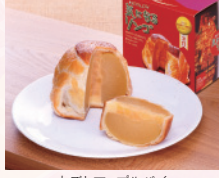
丸ごとアップルパイ

青森市は、八甲田連峰や陸奥湾などの美しい自然に囲まれ、四季折々の景観や、りんご、ホタテなど豊富な食材に恵まれています。また、日本を代表する火祭り「青森ねぶた祭」や世界遺産登録を目指す三内丸山遺跡をはじめとした縄文遺跡群など、文化や歴史、ここにしかない豊かな宝物を有している大変魅力的なまちです。