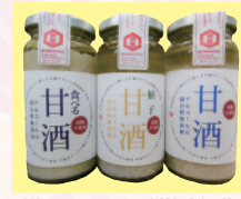
砂糖・アルコール不使用老舗醤油店の甘酒