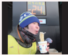
凍るヌードル「陸別町」

北海道十勝東北部に位置する4町、ギョウジャニンニクを始め山菜、イモ類・かぼちゃなどの農産物、秋鮭・ししゃもなどの水産物が豊富な「浦幌町」。鉄道運転体験のできる日本一寒いまち「陸別町」。高さ3mにもなる螺旋(らわん)プキや放牧酪農の盛んなまち「足寄町」。寒暖の差が大きく良質な豆の生産地「本別町」。広大な大地が生み出す農畜水産加工品をご賞味ください。