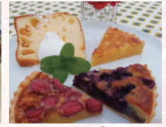
どちおとめたっぷりの「いちごタルト」