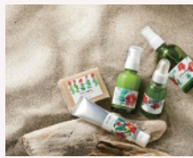
オーガニックコスメ rosa rugosa(ロザルゴサ)