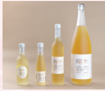
しゅわしゅわ木内梅酒