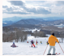
たんばらスキーパーク