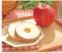
numaブランド クリスピーアップル

赤城山や武尊山など日本百名山に挙げられる山々に囲まれた自然豊かな沼田市。豊富な温泉群・スキー場・ゴルフ場・史跡・果樹園など関越道で交通アクセスも良い観光地です。市街地は利根川とその支流により形成された河岸段丘上に広がり古くは真田氏などの城下町として栄えました。自然と歴史の町 沼田の特産品を是非お試しください。