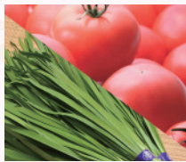
かぬまブランド「にら」・「トマト」