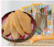
日本一の産地から「干しいも」

那珂市は、東京から北東へ約100km、茨城県の中央よりやや北側に位置します。春は「日本さくら名所100選」認定の八重桜、夏はひまわりが咲き誇り、関東一の越冬地古徳沼へ白鳥が飛来する四季ならではの景色が美しい街です。今回は、清流に抱かれた肥沃な大地で育まれた新鮮野菜や特産品等を販売いたします。那珂市の味覚をぜひご堪能ください!