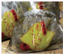
歯ごたえ抜群「手作りこんにゃく」