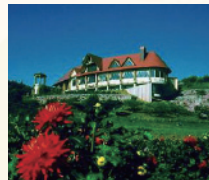
秋田国際ダリア園