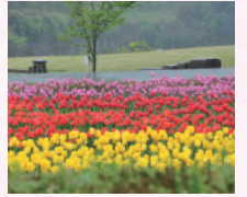
チューリップフェスタ(原尻の滝周辺)