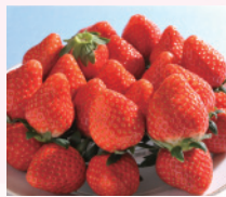
いちご市イチオシ「どちおとめ」

「いちご市かぬま」は東武浅草駅から80分、ユネスコ無形文化遺産に登録された祭りの主役、「彫刻屋台」のあるまち☆台東区自然の村あわ野山荘のある粟野町と合併し12年目のまちです。今回は本市が誇る新鮮ないちご、ニラ、トマト、こんにゃく、地酒など、選りすぐりの商品をご用意し、皆さまのご来店をお待ちしております。