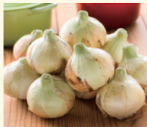
辛みが少なく甘い たまねぎ