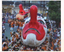
沼田まつりの天狗みこし