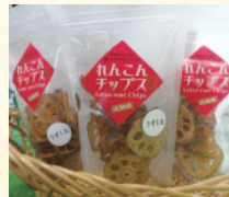
おやつにどうぞ れんこんチップス