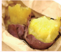
甘くてクリームのような焼き芋

ぶんごおおの市は、大分県南西部に位置し、「日本ジオパーク」と「ユネスコエコパーク」両方認定されている豊かな自然に囲まれたまちです。豊かな水と大自然がある恵まれた大地は、県内屈指の畑作地帯で、「大分の野菜畑」と言われ、甘藷、里芋、ピーマン、椎茸などの産地です。安心・安全な心のこもった特産品をご用意し、皆様のご来店をお待ちしています。