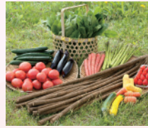
採れたて新鮮!那珂市の野菜