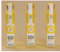
栄養満点「ひまわりオイル」