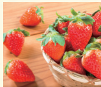
いちご(さがほのか)

佐賀県の南西部に位置し有明海に面している白石町は、古代から自然に陸化し、近世以降開発された広大な白石平野が広がる町です。その「土」はミネラルが多い粘土質で、米、野菜、果物の一大産地です。肥沃な大地で育った、いちご、たまねぎ、れんこんなどを中心に地元特産物を使用した加工品など出品いたします。ぜひぜひご来店ください!