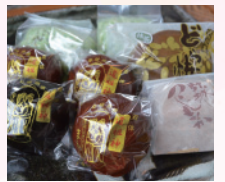
粟野の銘菓も勢揃い