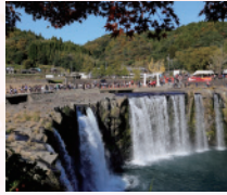
日本の滝百選 原尻の滝