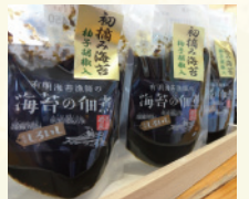
海苔の佃煮(有明海産)