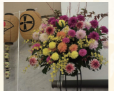
有望産品の一つであるダリア