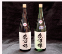
これぞ地酒「鹿沼娘」