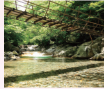
森林浴の森百選! 川上溪谷