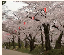
旧「久保田城」があった千秋公園