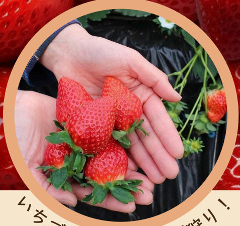
いちご市鹿沼でいちご狩り!