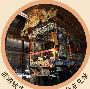
鹿沼秋まつりの彫刻屋台を見学