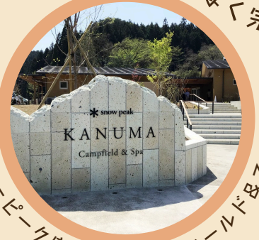
ノーピーク鹿沼キャンプフィールド&スパ