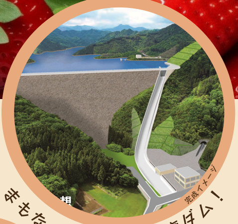
まもなく完成予定 南摩ダム!