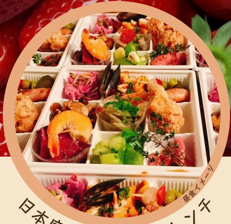
日本庭園で鹿沼のフルーツ