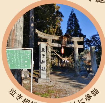
泣き相撲の生子神社に参詣