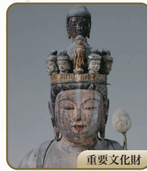
6 十一面観音立像 石道寺