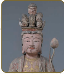
14 十一面観音立像 浄光寺