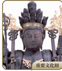
16 千手観音立像(御代仏) 千手院