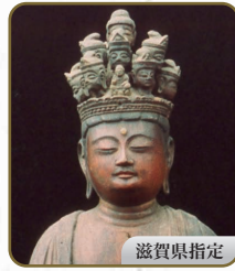
10 十一面観音立像 向源寺(渡岸寺観音堂)