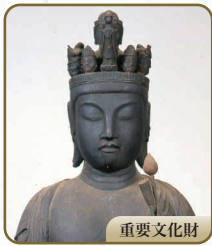
1 十一面観音立像 善隆寺(和藏堂)