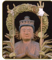
12 千手観音立像 保延寺観音堂