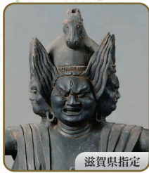
2 馬頭観音立像 徳圓寺