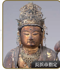
17 聖観音立像 大吉寺