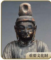
9 千手観音立像 赤後寺(日吉神社)