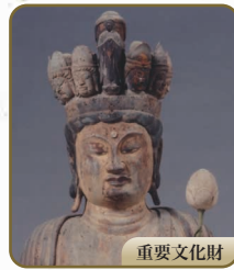
5 十一面観音立像 鶏足寺