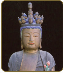
13 十一面観音立像 片山観音堂