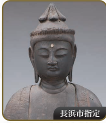
15 聖観音立像 常楽寺