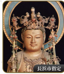
11 十一面観音坐像 井口日吉神社