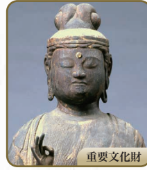
18 聖観音立像 総持寺