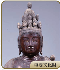
8 十一面観音立像 充滿寺(西野薬師堂)