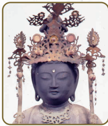
3 聖観音立像 西浅井町集福寺