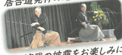
演武の披露をお楽しみに♪