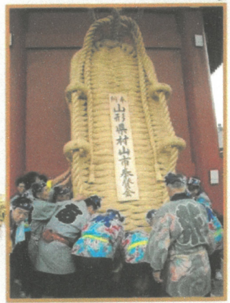
浅草寺宝蔵門大わらじ奉納の様子(2018年)