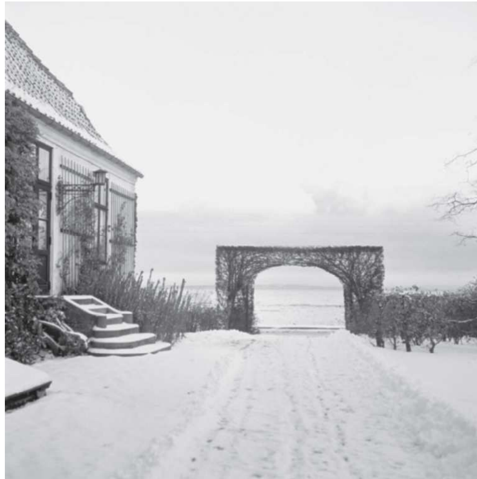
View toward the Sound. The main house is seen on the left.