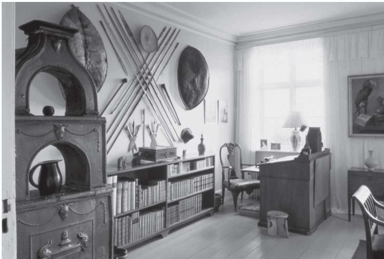
“Ewald’s Room”, where Karen Blixen wrote all her books.