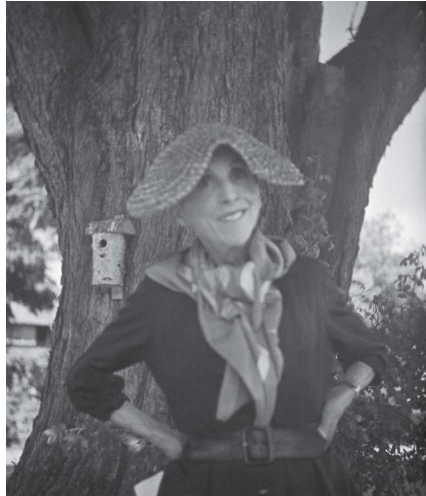
Steen Eiler Rasmussen's photograph of Karen Blixen in the bird sanctuary, ca. 1958. Behind her can be seen one of the many birdhouses.

カーアン・ブリクセン。1958年頃、野鳥保護区にて。ステイーン・アイラ・ラスムスン撮影。彼女のうしろに小鳥の巣箱が見える。