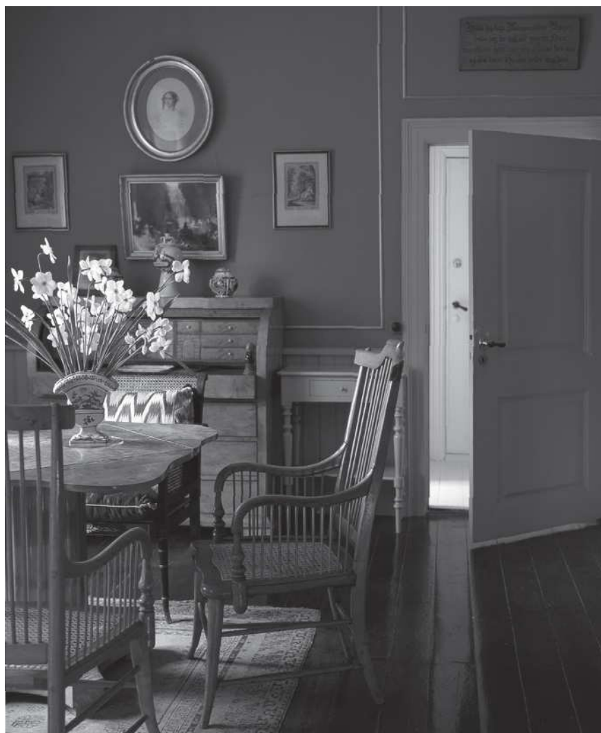
The Green Room.