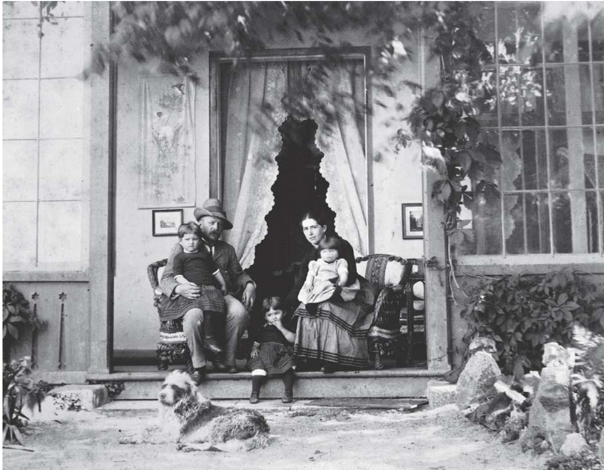
Wilhelm and Ingeborg Dinesen, Karen Blixen's parents, on the veranda in front of their estate Rungstedlund, north of Copenhagen, ca. 1888. They are seen here together with their three daughters, Inger (called Ea), Karen (called Tanne), and Ellen (called Elle).

ブリクセンの両親、ヴィルヘルム、インゲボ・ディーネセン。1888年頃、コペンハーゲンの北に位置するロングスタズロンの屋敷のベランダで。ともに写っているのは3人の娘、イーア（インゲ）、タネ（カーアン）、エレ（エレン）。