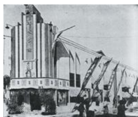
オペラ館