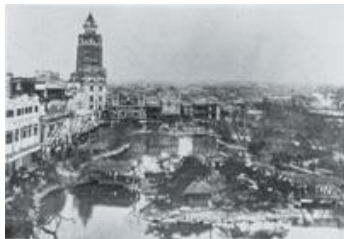
明治期の浅草公園

明治期に入り、境内が公園地として整備され「浅草六区」が誕生し、奥山芝居小屋、見世物小屋は公園六区興行街へと引き継がれ、映画街の代名詞として多くの人々に親しまれるようになります。大正期に至っては、映画などの興行場と浅草十二階と呼ばれた凌雲閣が人気を博し、「浅草オペラ」が、広く大衆に愛されることとなりました。