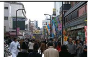
六区ブロードウェイ