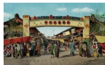
終戦後の仲見世

江戸随一の盛り場であった浅草は、江戸以来の演劇娯楽のメッカとして発展し、芸能と庶民文化の一大中心地として栄え、固有の歴史と文化に育まれた日本を代表する国際的な観光拠点となっています。