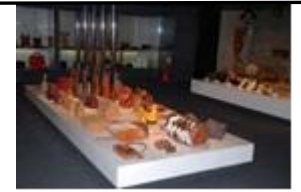
袋物参考館 (要予約)