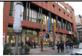
浅草公会堂・スターの広場