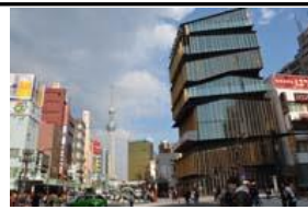
浅草文化観光センター