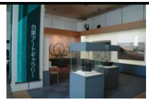
台東アートギャラリー