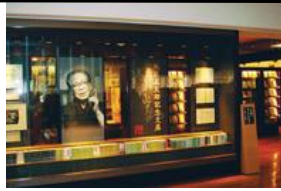
池波正太郎記念文庫