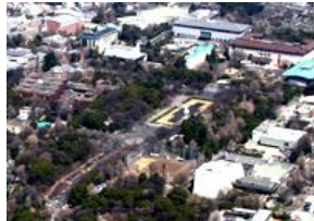
「上野の山文化ゾーン」全景