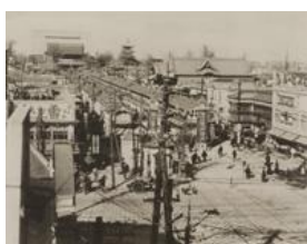
震災復興後の仲見世

大正12年の関東大震災により凌雲閣は崩壊、浅草地区では、全域に近い92.8%が焼失するなど、壊滅的な被害を受けました。しかし翌年には、興業街や映画街の各館が再建され、活力に満ちた街としてめざましい復興を遂げました。