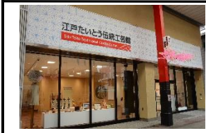
江戸たいとう伝統工芸館