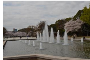
上野公園噴水広場