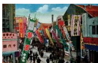
昭和期の浅草六区