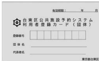
利用者登録カード（団体）：水色