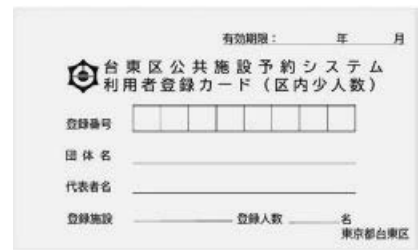
利用者登録カード（区内少人数）：黄色

利用者登録カードの紛失、盗難その他の事故が発生した場合には、直近で登録した窓口までご連絡ください。利用者登録カードを他人に譲渡し、又は貸与することはできません。