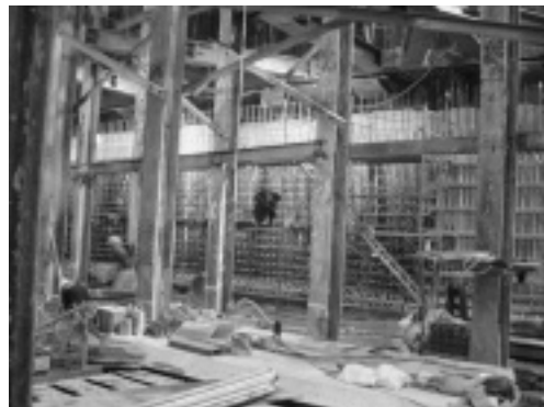
工事の様子（地下3階側壁：平成19年8月）