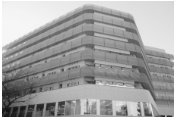
竣工後の建物外観

施設の運営は、指定管理者（☞解説）である、社団法人地域医療振興協会が行い、高齢者の地域での暮らしを支えるために必要なサービスを提供します。区は病院・老人保健施設の健全な運営のために評価・検証を行う協議会を設置し、区民が安心して利用できる病院にしていきます。