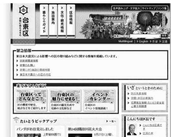
区の公式ホームページ

最近では、東日本大震災の影響に伴う被災地・被災者への支援や放射線に関する情報の掲載などで迅速な対応を行なっています。