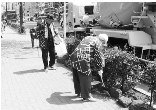
大江戸清掃隊活動の様子