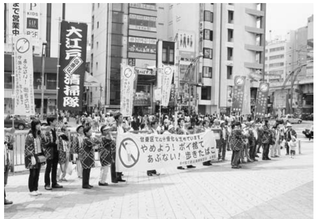
まちの美化啓発キャンペーンの様子