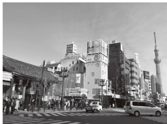
多様な景観資源が点在する浅草周辺