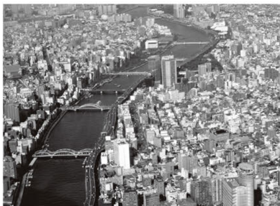
景観上重要な場所となっている隅田川

商店街など、特定の地域の人々がつくった景観に関するルールを区が認定し、地域の個性を活かした景観まちづくりを支援しています。