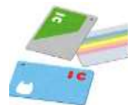
電子マネーで買う

では、どうして現金以外の支払い方法が増えているのか、現金払いと電子マネーで買い物した時の違いや注意点を考えてみましょう。