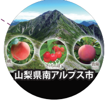
山梨県南アルプス市