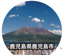
鹿児島県鹿児島市