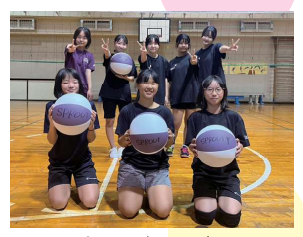
みんなビーチボールが大好き！

令和6年度から8年度までの間、金曾木小学校校舎の大規模改修工事が予定されており、学校施設の使用が難しくなるため、近隣地区のコミュニティ委員会の皆様にはいろいろとご協力を頂く事があるかと思いますが、その節はどうぞよろしくお願い申し上げます。