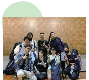
年代を超えて仲良くバドミントンを楽しんでいます。