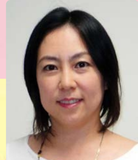
漫画家 倉田真由美さん

◆プロフィール 1995年、講談社ヤングマガジンにてギャグ大賞をとり漫画家デビュー。代表作はタメ男を渡り歩く女たちを描いた「だめんず・うぉ〜か〜」。マンガ・エッセイなどの執筆活動のほかに、恋愛・男女共同参画・子育て・文化等のテーマで、講演・トークショー、テレビ・ラジオ出演など多方面で活躍中。