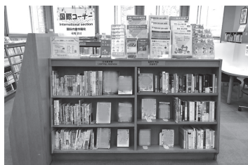
中央图书馆浅草桥分室(国际角)