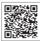
书籍检索请浏览此处