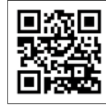
타이토구의 전통 공예 웹사이트