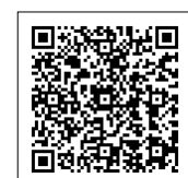
이곳을 통해서도 접속할 수 있습니다.