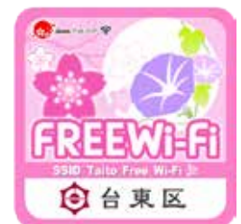
이 스티커가 있는 장소에서 사용할 수 있습니다