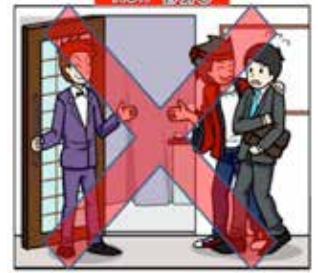
No!! 호객 행위

'호객'이나 '권유(스카우트)'를 할 목적으로 상대방을 기다리는 행위는 금지되어 있습니다.