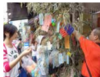
日语教室的七夕体验情景