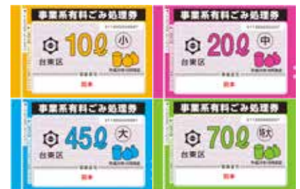
타이토구 사업계 유료 쓰레기 처리권

회사 및 가게에서 쓰레기를 배출할 때에는 비용이 듭니다. 폐기물 처리 업체 및 자원 회수 업체에 연락해 주십시오. 양이 많지 않을 때는 ‘타이토구 사업계 유료 쓰레기 처리권’ 을 부착하여 가정에서 배출되는 쓰레기와 같은 날에 배출해 주십시오. (45 ℓ 로 3 봉투가 대략적인 기준입니다.)