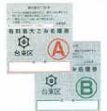
대형 쓰레기 처리권을 구입하여 부착합니다