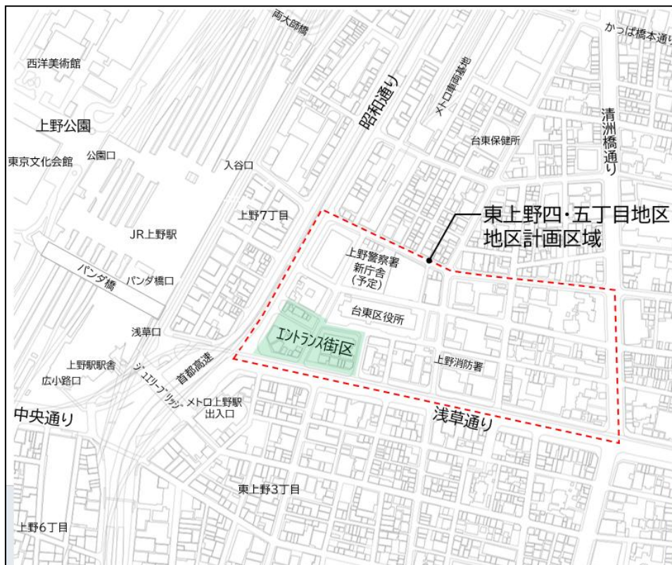
※上図は国土地理院基盤地図情報を加工し作成したもの

そこで、国立西洋美術館の周辺環境の保全と都市更新を両立しながら、本地区及び区全体の価値・魅力の向上や回遊性向上を図っていくため、実効性のあるまちづくり制度を導入することで、本地区のまちづくりの更なる進展に繋げていく。