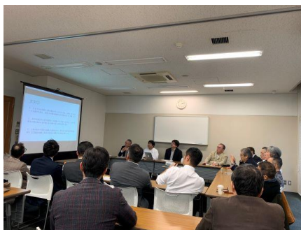
上野まちづくり協議会