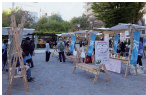
区内街区公園での社会実験(てん)