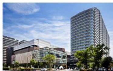
敷地北西側からの外観