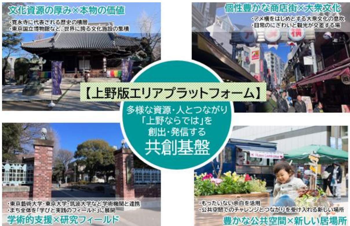
上野版エリアプラットフォームの骨子の考え方

※未来ビジョンは、エリアプラットフォームによる策定が求められ、将来の上野における区民・来街者の活動の様子や公共空間等の活用イメージ、その実現に向けた方向性を示す。