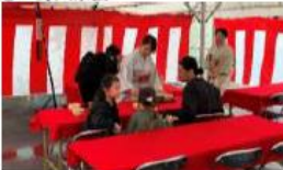
④光のアートメトロ