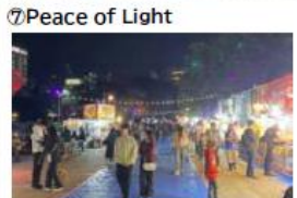
⑦Peace of Light