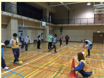
ブラインドサッカー