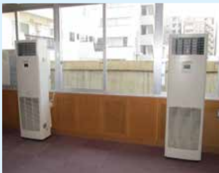
浅草中学校音楽準備室の空調

学校施設は児童・生徒・園児の学習・生活の場であり、地震等の災害発生時には地域住民の応急避難場所としての役割も果たします。この交付金は、教育環境の向上や防災機能強化を図るために、国がその整備に要する経費の一部を地方自治体に交付するものです。