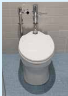
谷中小学校地下1階トイレ