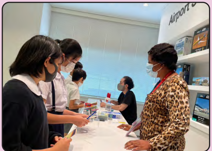
昨年度の「Tokyo Global Gateway Blue Ocean」の様子