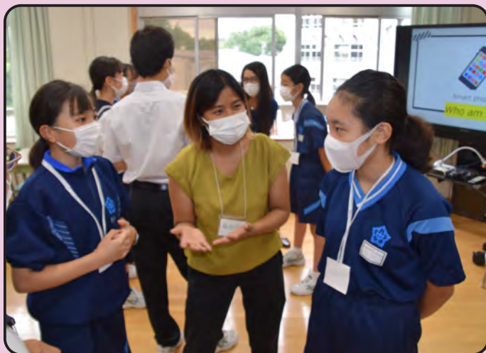
昨年度の「English Summer School」の様子

なお、令和2年度より休止している海外派遣事業は、令和6年度からの再開に向け、派遣先の検討も含めて準備を進めているところです。