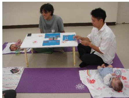
子供の足形を使ったカレンダー作り、ふれあい遊びなど。パパたちに大人気の講座です。