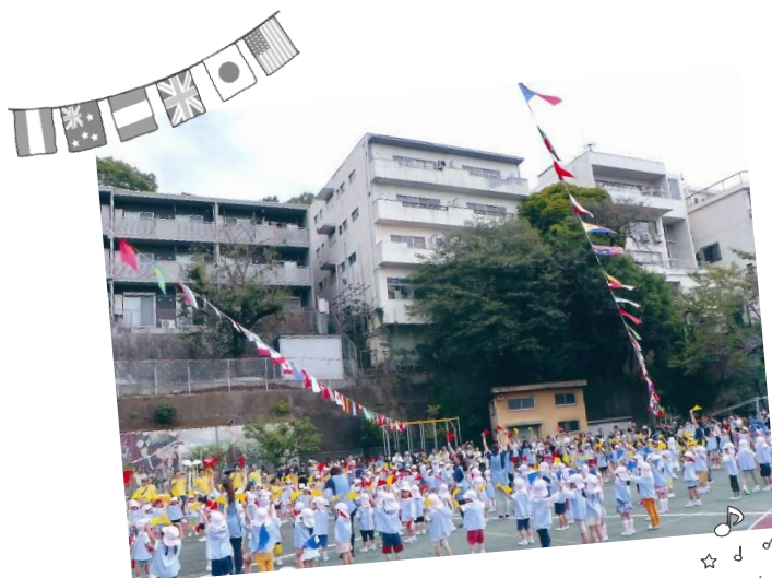
※写真は昨年撮影したものです