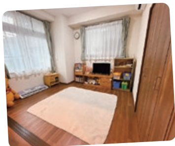
児童養護施設 クリスマス・フォレスト