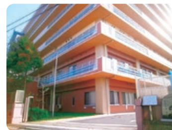
ほうらい子育てサポートセンター