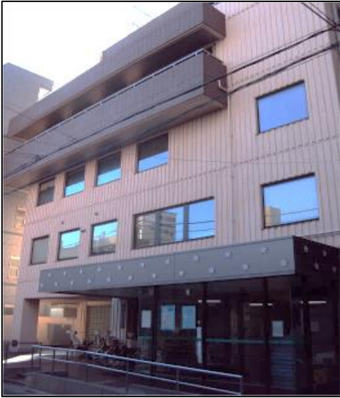
< 外 観 >