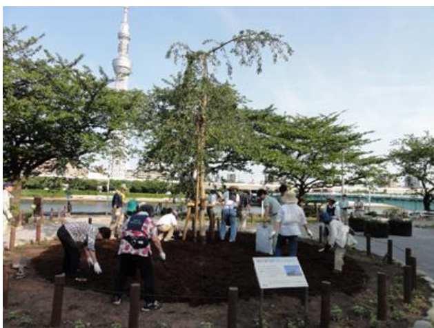
名称:隅田公園花の名所づくりボランティアグループ