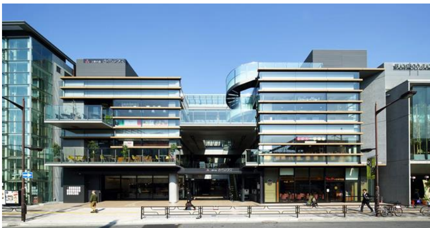
名称:上野の森さくらテラス