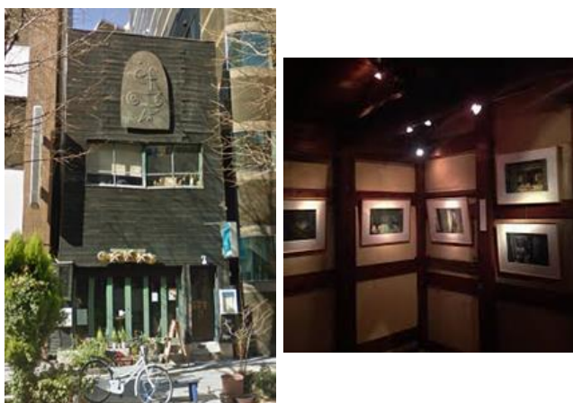
名称:ギャラリー・エフ

花を趣味とする方々が、自身の楽しみをパブリックに提供し、見る者の共感を得る点が高く評価できる