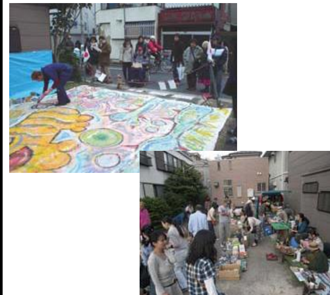
名称:貸はらっぱ音地(おんち)

台東区の強み、町会を中心とした地域の連帯が表現された会 地域の歴史を踏まえたコミュニティー育成活動として評価できる