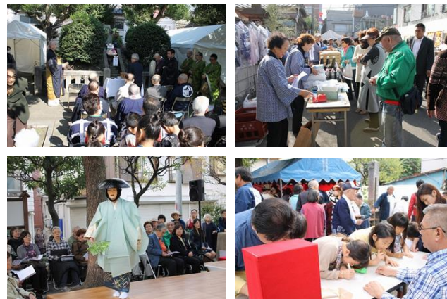
名称:石浜2丁目町会 妙亀塚保存会

地域の重要な景観資源である古い土蔵をリノベーションし、アーティストの活動の場として活用している 土蔵をリノベーションし活用するさきがけとなった功績は大きい