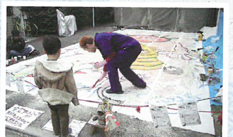
貸はらっぱ音地(おんち)