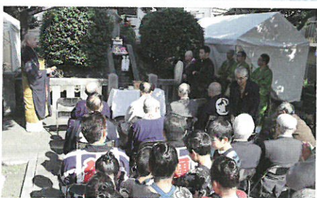
石浜2丁目町会 妙亀塚保存会