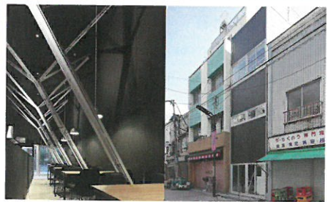
御徒町天ぷら酒処「天正」