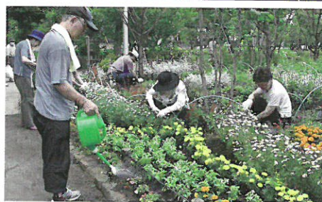
隅田公園花の名所づくり ボランティアグループ