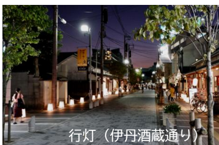
行灯（伊丹酒蔵通り）