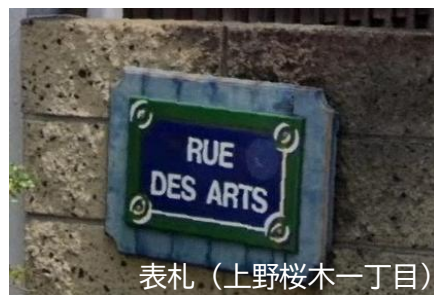
表札（上野桜木一丁目）