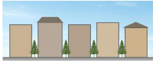
より狭い範囲で色の基準を設定 (例：同系色でまとめた場合)

周辺景観との調和を考慮し、適切な色の基準を設けることにより、周辺を含めた美しい街並みを実現することができます。