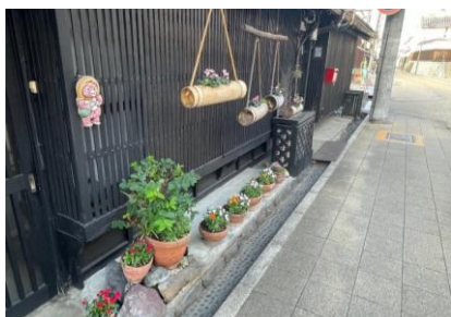
（名古屋市西区四間道）