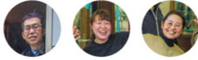
戸越 スルキ えもと (戸) (ス) (え)