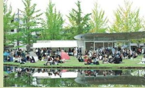
③ かかみがはら暮らし委員会 (岐阜県各務原市のコミュニティ)

2019年に東京の吉祥寺駅近くにオープンした、一つの棚を月3850円で貸している 棚貸しの本屋さん です。現在約70名の方が、棚主の契約をしています。最年少の借り手は小学生！カーブ好きの本棚など マニアックな本棚 が大変好評だそう。棚を見ると、多くの棚が「自分が今こうである」でなく、「これからこのようになりたい」状態を表現しているように見えてきます。自身がどのようにこのまちで生きていきたいかが表現されていて、棚主同士での交流が生まれたり、棚を疑似家族に見立てたりと、様々な楽しみ方で賑わいを見せています。