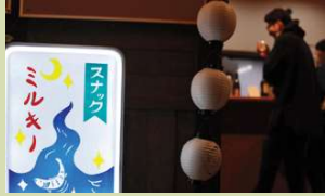
① MINDTRAIL 奥大和 心のなかの美術館 (奈良県南部・東部の芸術祭)

この芸術祭のキュレーションを行いました。その活動の一つが スナック のマスターとしてスナック3店舗を開業することでした。芸術が好きな若い人たちとずっと交流できればという地域の人たちの想いから、お互いが出会うきっかけとなる場をつくらうと考えました。始めてみると、スナックは大入り満員となりました。多くの人たちが面と向かった交流ではなく、一人と一人が斜めに会おう「斜めの接点」を持つことでおもしろいことを生み出します。50代、60代の地域の方々や若い人たちの出会いをどう設計するかということを、 メディアの手法 をうまく使って取り組むことができました。