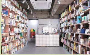
② ブックマンション (東京都吉祥寺の本屋さん)

この芸術祭のキュレーションを行いました。その活動の一つが スナック のマスターとしてスナック3店舗を開業することでした。芸術が好きな若い人たちとずっと交流できればという地域の人たちの想いから、お互いが出会うきっかけとなる場をつくらうと考えました。始めてみると、スナックは大入り満員となりました。多くの人たちが面と向かった交流ではなく、一人と一人が斜めに会おう「斜めの接点」を持つことでおもしろいことを生み出します。50代、60代の地域の方々や若い人たちの出会いをどう設計するかということを、 メディアの手法 をうまく使って取り組むことができました。