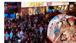
▲興行街のにぎわい