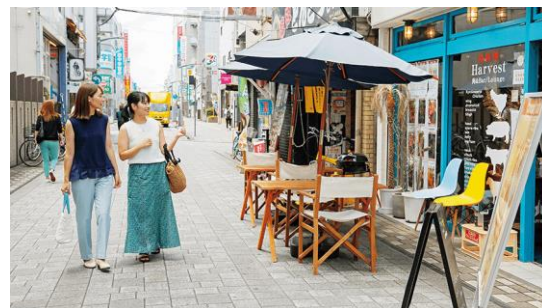
▲道路と店舗が境無くつながり、テラス席が道路側に滲み出す等、居心地がいい空間を創出した事例（広島県福山市）