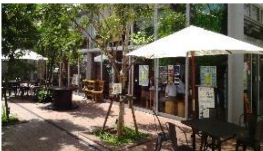
▲低層部をガラス張りの店舗にリノベーションし、アクティビティを可視化した例（宮崎県日南市）