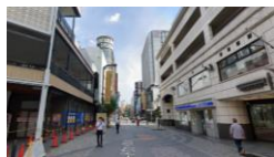
▲六区ブロードウェイ（現況）