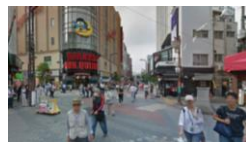
▲主要な通りが交わる辻広場（現況）