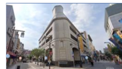
▲景観規制・誘導の例（現況）