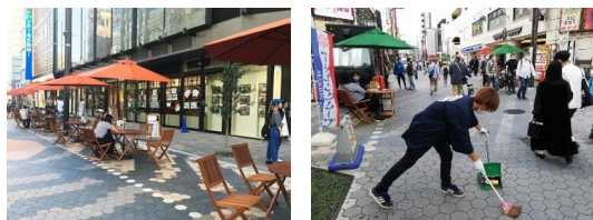
▲浅草六区エリアマネジメントにおける活動の展開