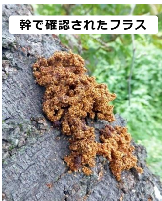
幹で確認されたフラス