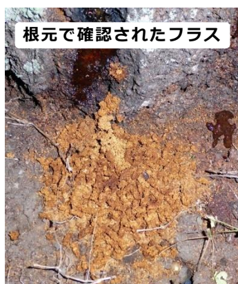
根元で確認されたフラス

6月～9月に、下の写真のような『フラス』(幼虫が排出する木屑と糞が混ざったもの)が出ていないかを確認して下さい。点検するポイントは右の写真を参考にして下さい。