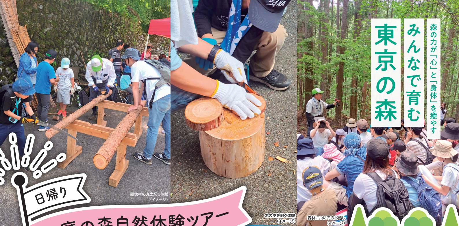
間伐材の丸太切り体験 (イメージ)