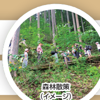
森林散策 (イタース)

ご旅行内容はプリントしてご確認ください。詳しい旅行条件を必ずお読みいただいたうえで申し込みください。