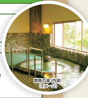
数馬の湯(内湯) (イタース)

午前:8:00~12:00、昼:12:00~14:00、午後:12:00~18:00