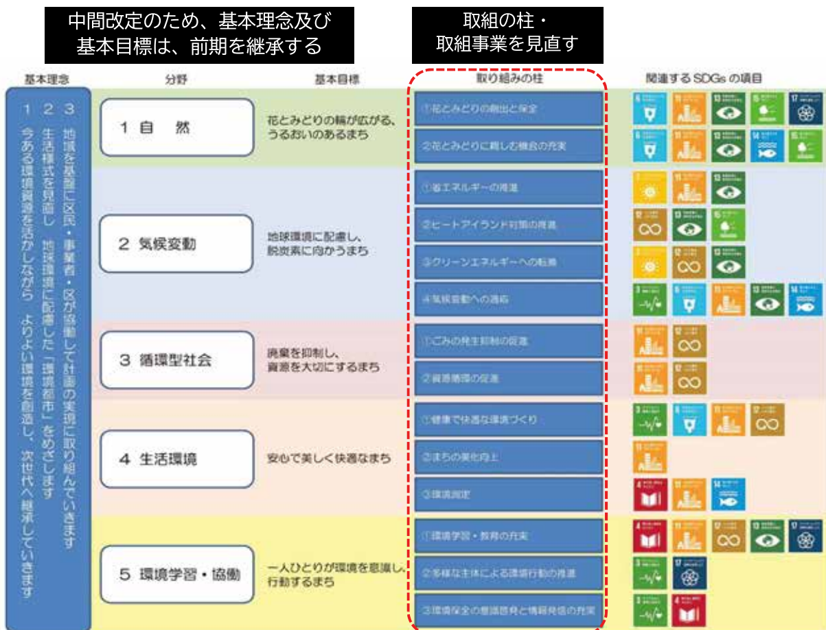
台東区環境基本計画（前期）の施策体系と改定の基本的な考え方

中間改定では、基本理念、基本目標など骨子となる枠組みは前期を継承し、改定の背景となる社会情勢等の変化や前期の進捗状況などを踏まえて、取組の柱及び取組事業を中心に見直しを行うものです。