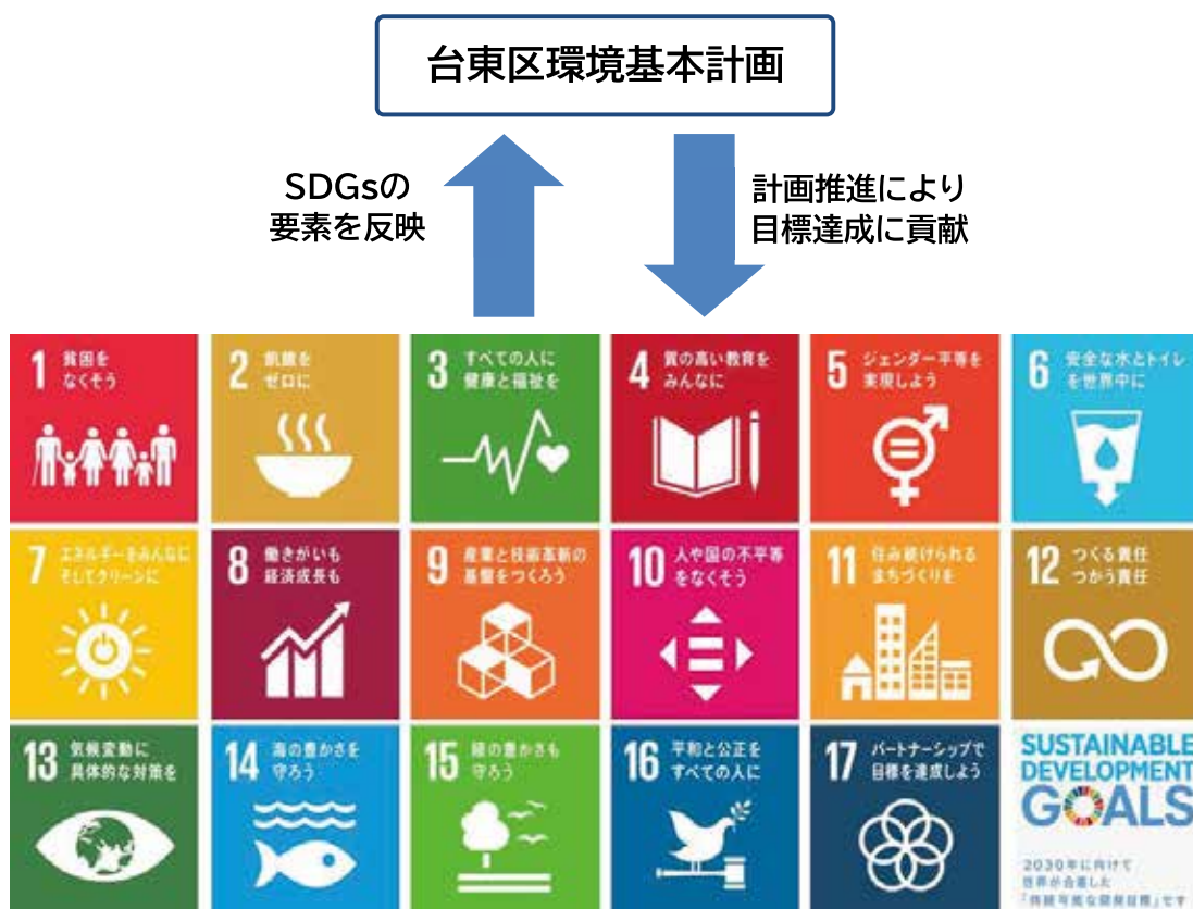
本計画と持続可能な開発目標（SDGs）の関係

本計画も全ての分野でSDGsと深く関連しており（ 49ページ ）、SDGsの目標達成に向け、計画の着実な推進を図っていきます。