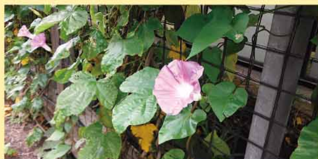
台東区の花 あさがお

ぜひご家庭や事業所でも花を育て、花を飾り、区内を花でいっぱいにして、みんなで花を楽しみましょう。