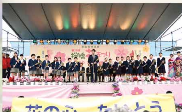
平成28年4月3日「花の心 たいとう宣言式典」が挙行されました。