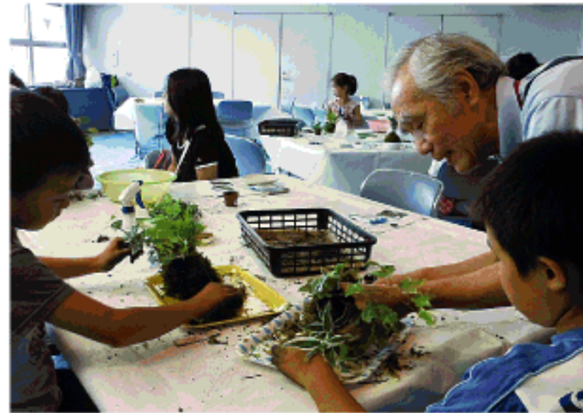
参加者へのサポートの様子

その後の小学生のお子さんと保護者の方が参加した講習会では、事前に学んだことを活かし、1人では難しい作業などのサポートを行いました。