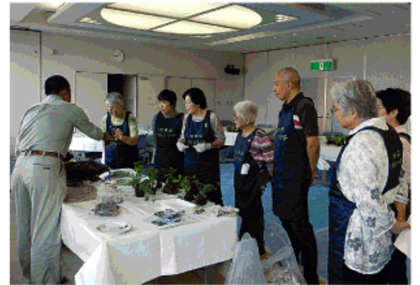
コケ玉について学ぶグリーン・リーダー