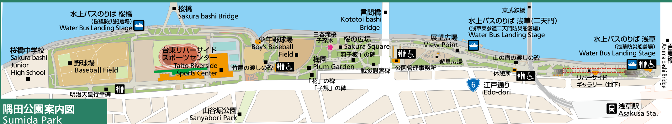
隅田公園案内図 Sumida Park