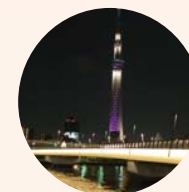
照明が灯る夜の桜橋 スカイツリーのライトアップも美しく見えます。

桜橋は隅田川両岸に沿って広がる「隅田公園」の台東区側と墨田区側を結ぶ歩行者用橋です。姉妹都市である台東区と墨田区の象徴として、1980年（昭和55年）から建設がはじまり、1985年（昭和60年）に完成しました。優美な曲線をもつX字型の美しい橋のデザインは、周辺の景観に配慮したもので、橋の色彩などにも工夫を凝らして建設しています。