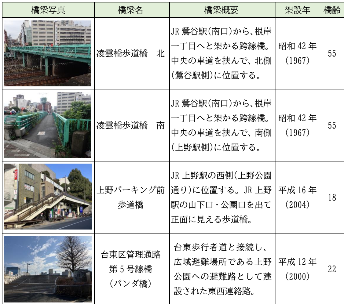
表-1 本区の管理する橋梁